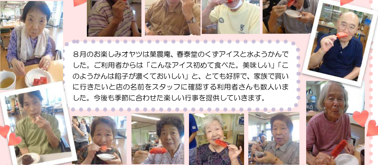
(お写真及びお名前の使用については、ご利用者様、ご家族様の許可を頂き掲載しています。)

8月のお楽しみオヤツは菓農庵、春泰堂のくずアイスと水ようかんでした。ご利用者からは「こんなアイス初めて食べた。美味しい」「このようかんは餡子が濃くておいしい」と、とても好評で、家族で買いに行きたいと店の名前をスタッフに確認する利用者さんも数人いました。今後も季節に合わせた楽しい行事を提供していきます。